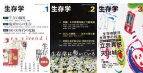
(2009年3月刊行) (2010年3月刊行) (2011年3月刊行)