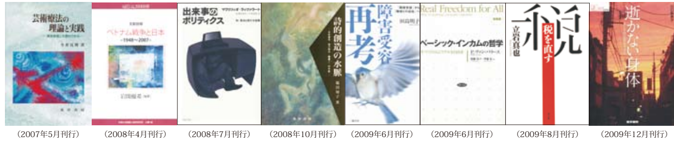
(2007年5月刊行) (2008年4月刊行) (2008年7月刊行) (2008年10月刊行) (2009年6月刊行) (2009年6月刊行) (2009年8月刊行) (2009年12月刊行)