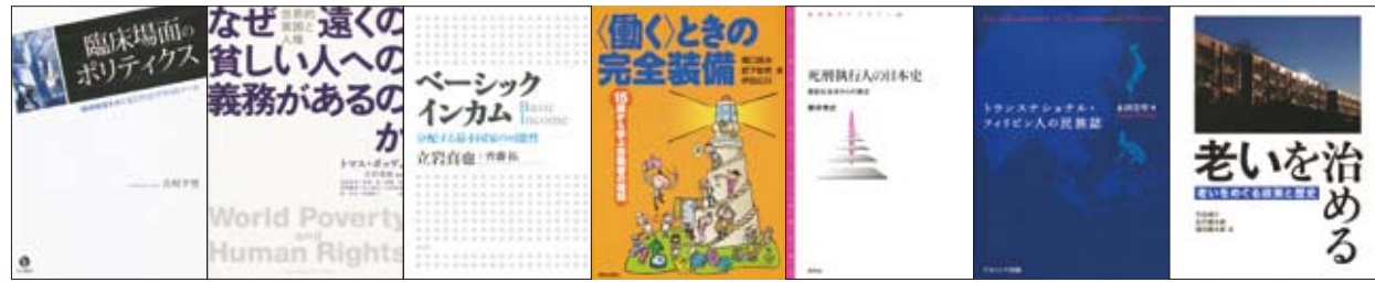
(2009年12月刊行) (2010年3月刊行) (2010年4月刊行) (2010年9月刊行) (2011年1月刊行) (2011年3月刊行) (2011年3月刊行) (単著・編著のみ。共著は除く。)